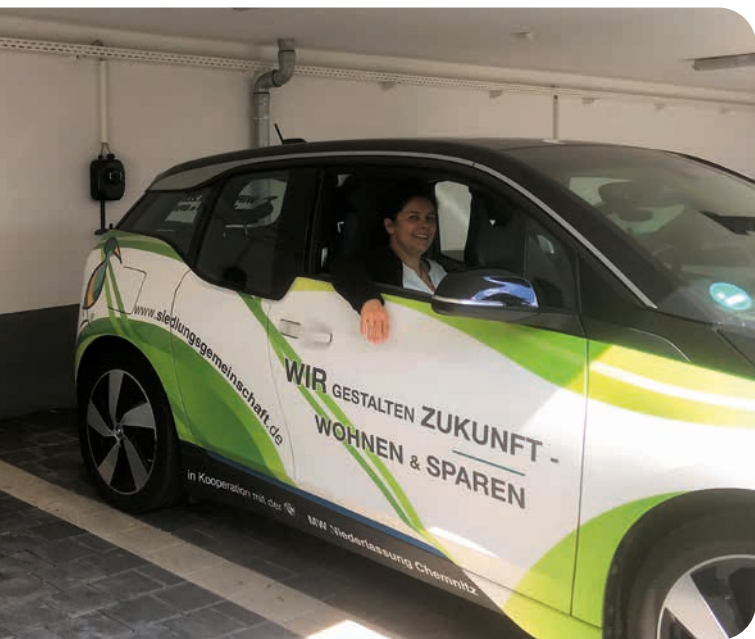
Ladepunkte für Elektrofahrzeuge am Carport der Wohnanlage „Die tanzenden Siedlung“

Es geht voran. Am Neubau „Die tanzende Siedlung“ werden sowohl am Carport als auch in der Tiefgarage mehr und mehr Ladepunkte für Elektrofahrzeuge aufgebaut. Diese werden an den gemieteten Stellplätzen mit Solarstrom von den Dächern der Wohnhäuser sowie Grünstrom aus dem Netz geladen. Die Ladepunkte sind in ein Lastmanagement integriert, d. h. der Stromverbrauch an den Ladepunkten kann intelligent gesteuert und somit die verfügbare Ladeleistung optimal aufgeteilt werden.