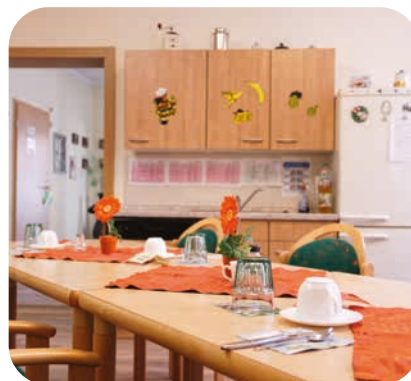
Die hellen Räume der Tagespflege „Haus Sonne“ laden zum Wohlfühlen ein

AWO Tagespflege „Haus Sonne“ Hainstraße 125 | 09130 Chemnitz Tel.: 0371 2731 6776 E-Mail: haus.sonne@awo-chemnitz.de