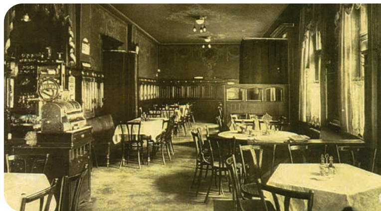
Innenansicht der Gaststätte „Zum Kaiserplatz“