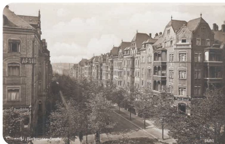
Barbarossastraße in Richtung Limbacher Straße